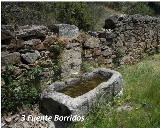
3 Fuente Borrídos

Como a unos 200 metros el paisaje se abre al finalizar las construcciones dándonos paso a una sobrecogedora vista sobre el barranco del río a nuestros pies y arriba la Najarra. Unos metros más abajo nos topamos a mano derecha del camino con la Fuente de los Borricos (2), parada frecuentada antiguamente por los trabajadores del monte y sus bestias a la vuelta del trabajo. Continuamos por este agradable paseo descendiendo en dirección al río y al poco podemos divisar en la otra orilla las ruinas del molino de Salustiano (3), vestigio de la antigua industria molinera que en Miraflores floreció en siglos pasados. A él podremos acceder cruzando el recientemente restaurado puente sobre el río Miraflores.