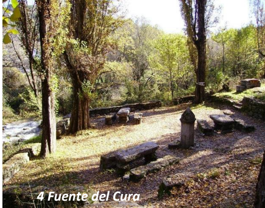
4 Fuente del Cura

Tras unos 200 metros llegamos a la zona de aparcamiento situada en los alrededores de la Gruta