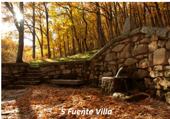
5 Fuente Villa

reutilizada aquí con motivo paisajístico. Continuaremos cruzando el puente para, al poco, tomar a nuestra izquierda la calle Vicente Aleixandre que nos llevará a la Carretera de Rascafría y de ahí al punto de partida.