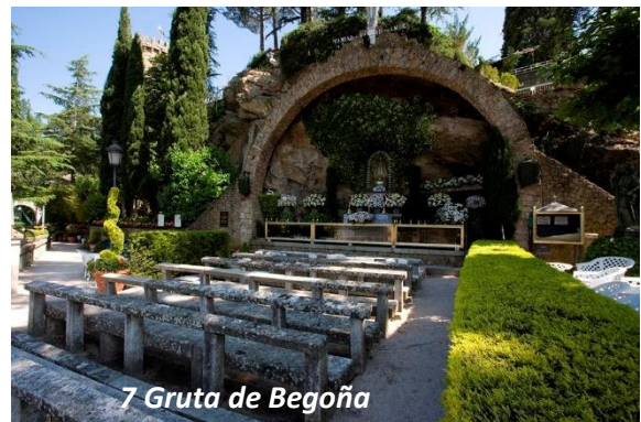
7 Gruta de Begoña