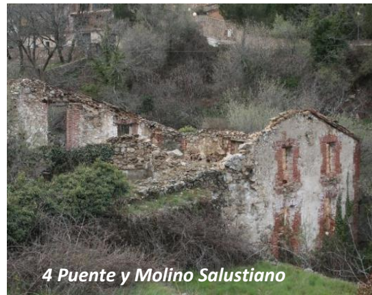
4 Puente y Molino Salustiano

Volviendo al camino que llevábamos, en unos pocos metros llegaremos al Área Recreativa de la Fuente del Cura, aunque lo primero que divisemos sea Fuente de la Villa (4), restaurada y ampliada a finales de los años 60 del S.XX. La Fuente del Cura (5), más modesta en proporciones que la anterior pero mucho más bella en su simplicidad, la encontraremos un poco más abajo, junto al río. Data del 1888 y debe su nombre al rico eclesiástico, nacido en Porquerizas en 1567, Juan González Borizo dueño de estas tierras en la antigüedad.